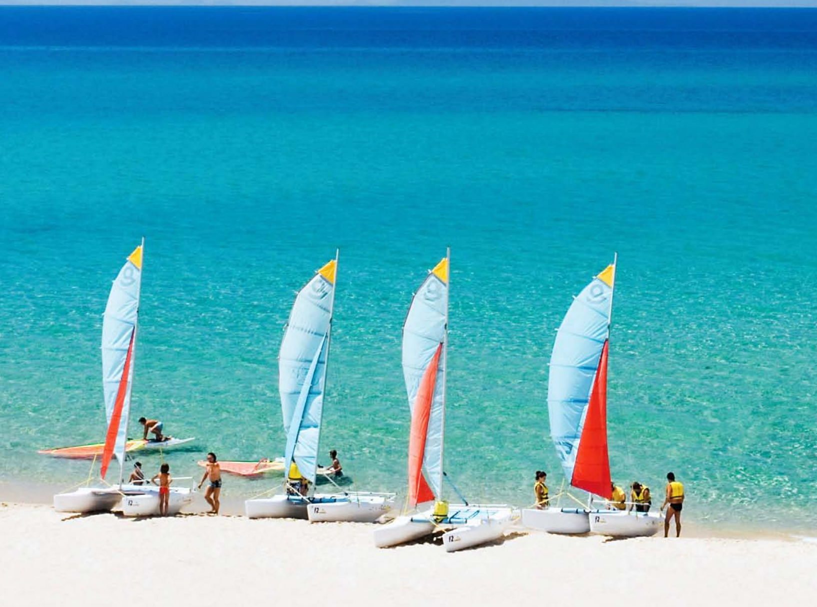
Spiaggia Resort & SPA Le Dune

hotels & resorts DELPHINA un Amico in Sardegna f t i